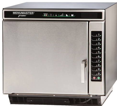
Modèle JET514V illustré

4 fois plus rapide que les fours conventionnels.